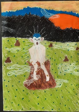
Hugo Simberg Frosten 1895 Nordre Carlsplan